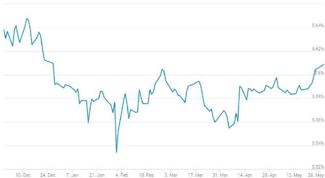
3-mjesečni USD Libor

Ostvaren bonus: Zarada dosadašnjim bonusima iznosi 7,65% uloženog, a ostvareno je 17 bonusa.