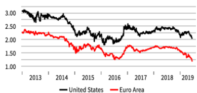
Inflation expectations keep sinking US and Euro Area Inflation Swap Forward 5y5y (%)