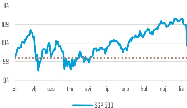
S&P 500 daily rate, in net returns