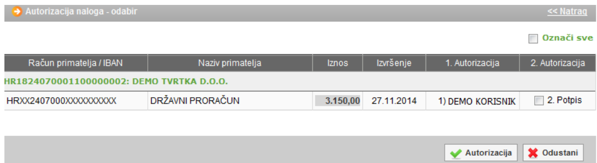
Slika 5. Prikaz zaslona kod drugog potpisa

Kako bi se napravila druga autorizacija s obavezno drugim tokenom (djelatnikom) na razini istog poslovnog subjekta koji ima ovlast autorizacije, korisnik drugog tokena se mora prijaviti u internet bankarstvo OTP banke d.d. i napraviti jednak postupak kao što je to učinio u ovom slučaju prvi token (djelatnik). U nastavku je slika zaslona kakvu vidi drugi token ovlašten za autorizaciju (Slika 5.):