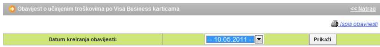
Slika 1. Pregled obavijesti o troškovima

Opcija "Pregled obavijesti" omogućuje pretraživanje i ispis Obavijesti o troškovima učinjenim Visa Business karticama. U padajućem izborniku odaberite datum kreiranja obavijesti. Odabirom opcije "Pretraži", na zaslonu se prikazuje Obavijest o učinjenim troškovima za odabrani datum (obračunski period) (Slika 1.).