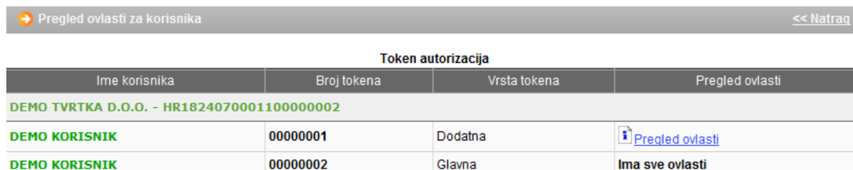
Slika 4. Pregled ovlasti za korisnika

U zaslonu "Pregled ovlasti" možete provjeriti koje ovlasti ima svaka od dodatnih kartica/PKI USB/tokena. Odaberite opciju "Pregled ovlasti" desno od imena korisnika sa dodatnom karticom/PKI USB-om/tokenom (Slika 4.):